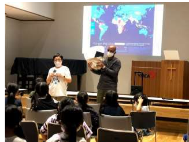
世界食糧デーワークショップ