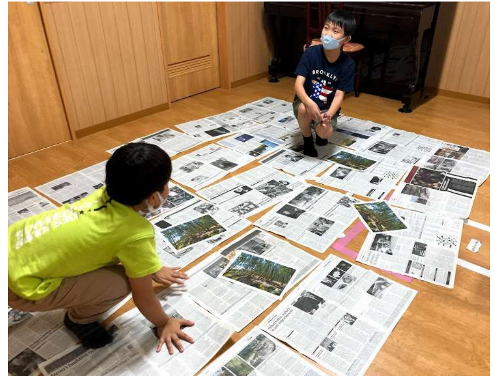
ユーカリの森体験