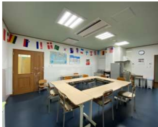
国際交流室 アーク