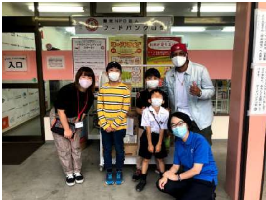
フードバンクへ食料の寄付