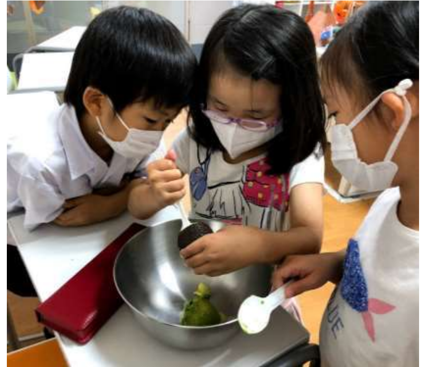
Discover Mexico Cooking