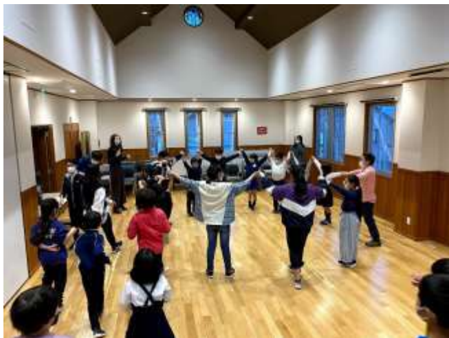
からだで感じるフランス