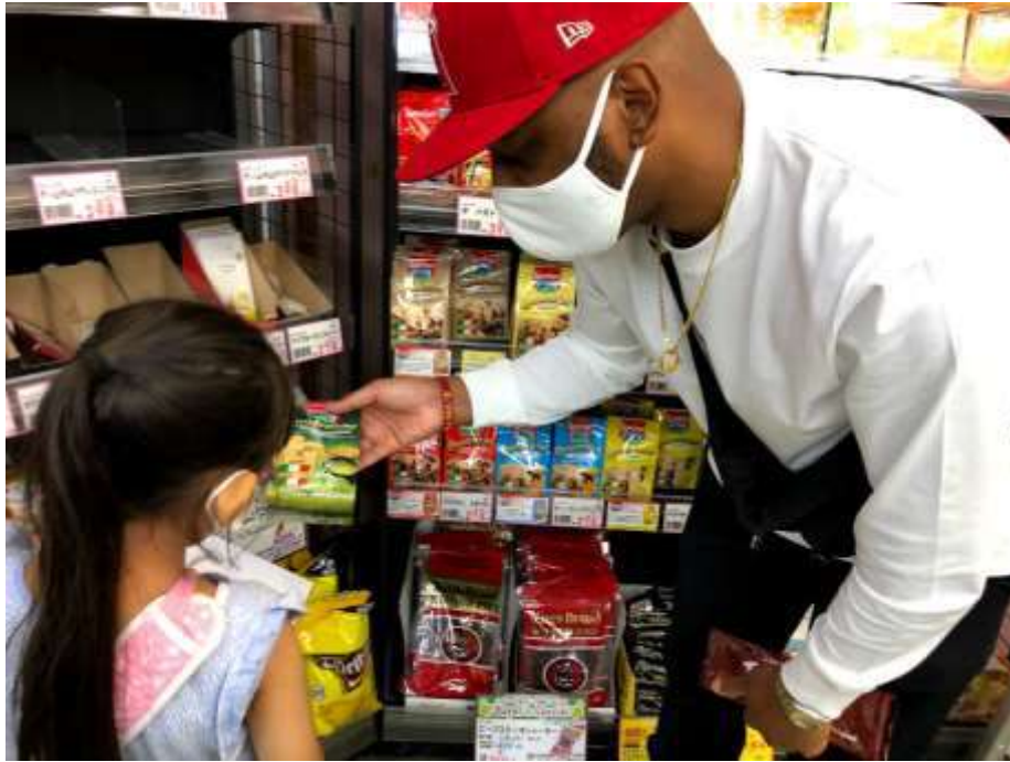
食べ物で世界旅行（食のグローバル化）